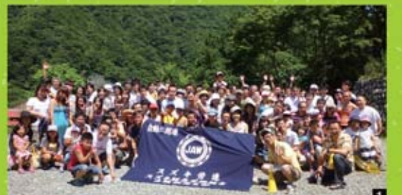
1 お決まりの全員で集合写真。みんな笑顔が素敵!!

今回は『家族も参加!』をモットーに総勢113名の大型企画となりました。普段会う機会のない社員のお子様の顔を拝見して『父親と似てない』とか『子供の方がしっかりしてる』など、妙なテンションで盛り上がりおりました。当日は気温が急上昇して猛暑日となりましたが、ケガや事故も無く、本当に楽しい一日を過ごせました。