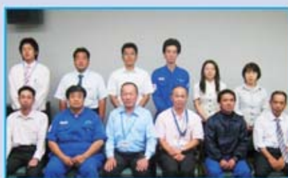
スズキ岡山支部 組合役員の皆さん

Q みなさんへのメッセージ 結成したばかりのスズキ岡山支部ですが、みなさんと一緒に頑張っています。晴れの国・岡山は美味しいもの盛り沢山です。是非お越しになってください。