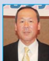
藤原支部執行委員長

■住所 / 岡山市北区津島笹が淵4-3 上山ビル1F ■TEL / (086)252-3789 ■営業時間 / (月・水~金) 11:30~15:00、17:00~22:00 (土・日・祝日) 11:00~15:30、17:00~22:00 ■定休日 / 火曜日 ■駐車場 / あり(13台)