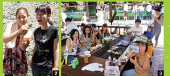
2 おいおい、そのまま食べてはいけませんよ。3 大勢の家族で食べるバーベキューはサイコー!!