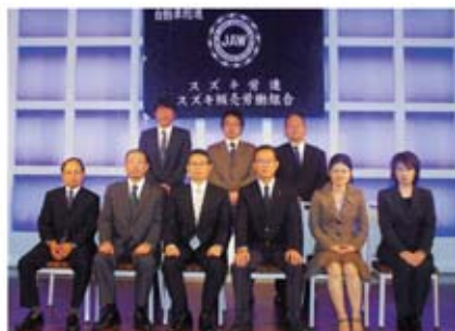
池富中央執行委員長と退任役員の方々。