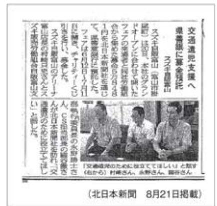
(北日本新聞 8月21日掲載)