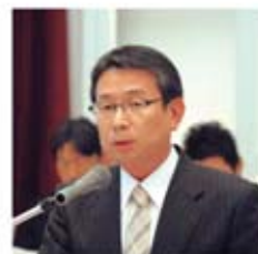
池富中央執行委員長