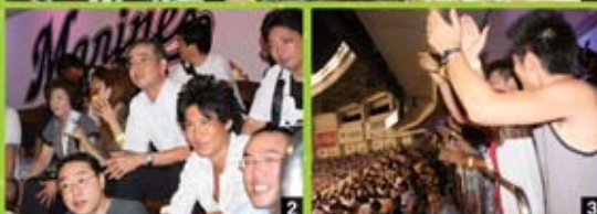
1 2 3 特別スタンド貸切でとても広々、みな大喜び!!120名の大観戦!!