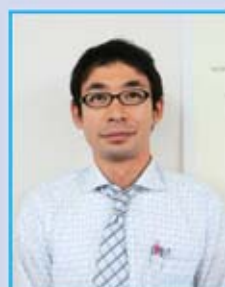
能登支部執行委員長

私を含めてまだまだ組合活動に対する知識・経験不足を痛感している毎日です。執行部を含め全員がもっといろいろ勉強していきたいと思えます。会社全員が目標に向かって同じ方向をむいていくそんな活動をしたいです。