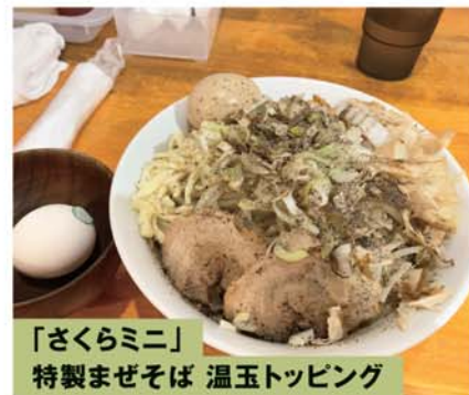
「さくらミニ」 特製まぜそば 温玉トッピング