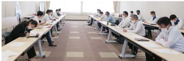
▲⑤第16期 第3回 国内営業本部との意見交換会、会場の様子

中期経営計画達成に向けた代理店の具体的な取り組みについて会社側からお話を伺い、組合からは、代理店に導入されている電子工程管理板の活用状況やリコール対応の現状など現場の声を届けました。また、新型コロナウイルス対応についての意見交換を行いました。