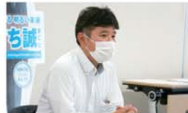
▲⑤昇中央執行委員長