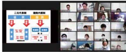
▲④スズキ労連 政治セミナー。WEB会議の様子