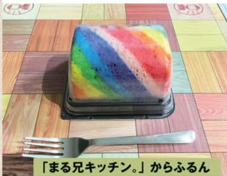
「まる兄キッチン。」からふるん