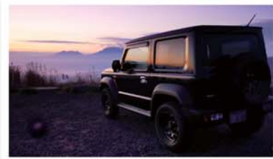
「後世に残したい車と景色」