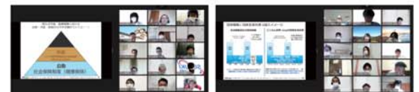
▲⑧福祉対策部長会議。WEB会議の様子