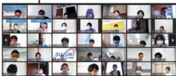
▲⑦書記長会議。WEB会議の様子