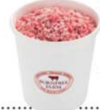
▲十勝スロウフード「牛とろフランク」