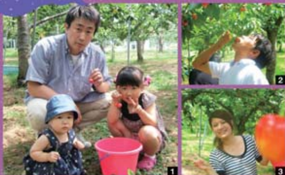
1 親子でさくらんぼ狩りを楽しんでいます♪♪ 2 さくらんぼ丸ごと食べま～す♪ 3 さくらんぼと一緒にハイチーズ!!