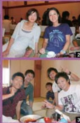
1 全員で記念撮影です!! 2 豪華懐石料理を堪能しました♪ 3 みんなで楽しくやっています~