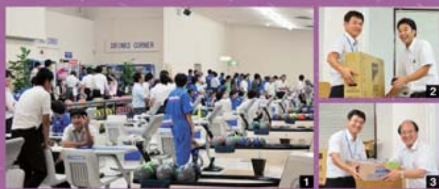
1 ゲーム中の様子です。 2 豪華景品GET!! 大きな景品おめでとう。 3 豪華景品GET!! 2人とも笑顔がいいですね～