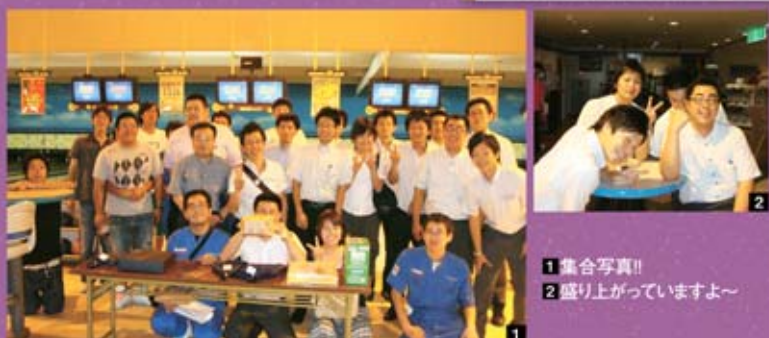
1 集合写真!! 2 盛り上がっていますよ～