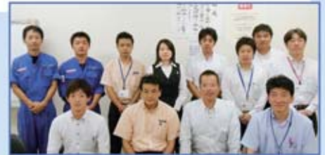
自販長崎支部 組合役員の皆さん

スズキ自販労働組合の加盟支部すべての力を合わせ、みんなが幸せになれるように頑張っていきたいと思います。