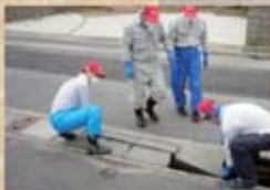
側溝の泥出し作業の様子