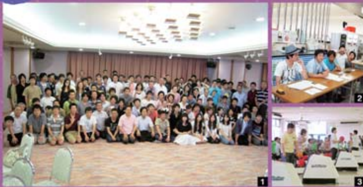
1 全員で記念撮影です。 2 受付中です!! 3 さあ、注目の投球です。