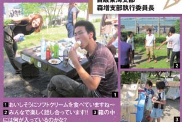
1 おいしそうにソフトクリームを食べていますね～ 2 みんなで楽しく話合っています!! 3 箱の中には何が入っているのかな?