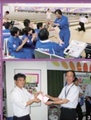
1 ゲーム開催中です。 2 やったぜ!ストライク! 3 スズキ労働賞を獲得しました!!