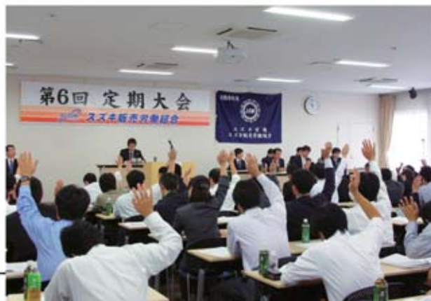
第7期 予算案を採決している様子