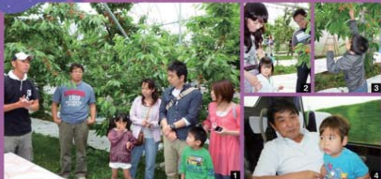
1 さくらんぼ狩りをこれからスタートします。 2 さくらんぼ狩り初体験頑張りました。 3 さくらんぼ狩りの様子。 4 バスの中でも皆仲良く盛り上がっています!!