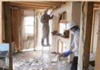
20日、22日の作業現場と壁の剥離作業と瓦礫の撤去の様子