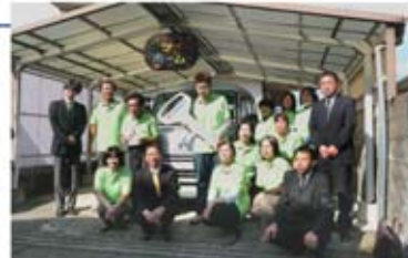
寄贈式後、エブリイを囲んで記念撮影