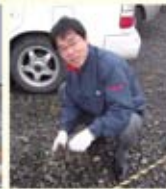
僕イケメン経営次長