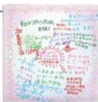
お礼のメッセージ