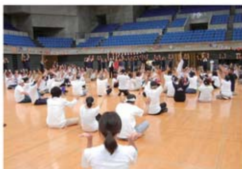
全員で元気に取り組みました。