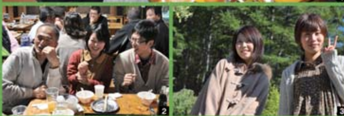
1 BBQおいしそうです。目隠ししたのは誰ですか? 2 3人の笑顔がいいですね～ 3 景色も最高です♪