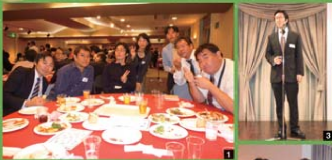
1 盛り上がっていますよ～ 2 ビンゴ大会 3 え～ひと 言ご挨拶 4 何か打ち合 わせ中のようにですね～