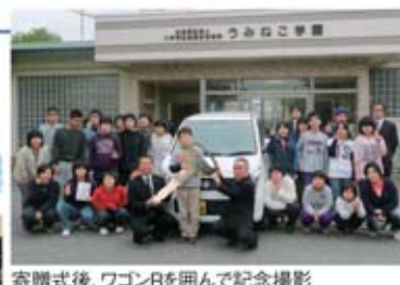
寄贈式後、ワゴンRを囲んで記念撮影