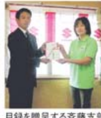
目録を贈呈する斉藤支部執行委員長(左)