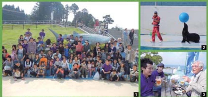
1 参加者全員で集合写真!! 2 楽しいショーを満喫!! 3 ランチタイム～ 話も弾んでいます♪