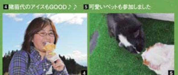
4 猪苗代のアイスもGOOD♪♪ 5 可愛いイベントも参加しました