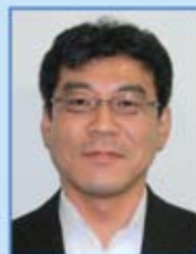
池田支部執行委員長

レクリエーション活動を通して、社員同士が仲良く団結力のある職場を作って行けたらと思います。