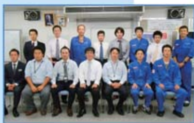
自販群馬支部 組合役員の皆さん

組合員の皆さんと一緒に会社を盛り上げて行きたいと思っておりますので、今後ともご協力をお願いします。