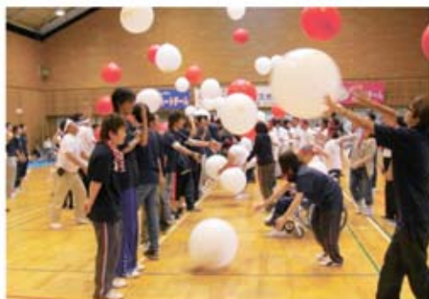
ふうせん競技の様子