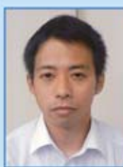
斉藤支部執行委員長