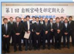
自販宮崎支部 組合役員の皆さん

ひとりひとりの力は小さいかもしれませんが、みんなで力を合わせれば大きな力になります。スズキ販売労働組合も全国規模になりました。これから全国の仲間と共に頑張っていきたいと思います。