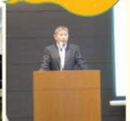
労働法務局 梅崎局長