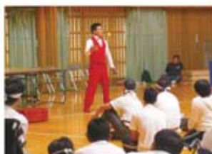
ジャグリング、大変楽しかったです。