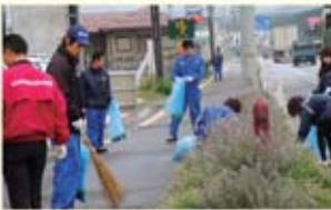
ゴミすっばどあるじゃ〜

2011年10月7日(金)、総勢142名で会社周辺クリーンアップ運動を行いました。今回は各営業所ごとで会社周辺を重点的にクリーンアップ運動を行いました。当日は朝から雨天のため中止かと思われましたが、集合時間が近づくと晴れたので無事清掃活動ができました。多数の組合員、管理職の方々も参加し会社