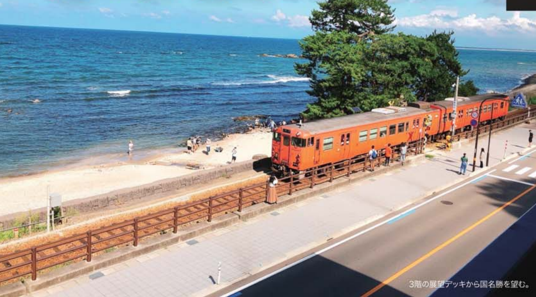
3階の展望デッキから国名勝を望む。