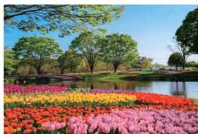
▲色も種類も豊富な映えチューリップ畑。

川市にある「国営昭和記念公園」は、東京ドーム約35個分の広さを誇る東京最大の国営公園です。都内から40分程で行ける自然豊かな公園で、施設も充実。大人から子供まで楽しめるのもちろん、ワークシヨップやイベントも行われています。年間で800種類を超える花・植物が育てられ、春にはサクラをはじめ、チューリップガーデンやツツジ、真っ赤なポピーなどが色鮮やかに咲き誇ります。夏にはアジサイやヒマワリ、秋はコスモスや紅葉、冬のサザンカやウメもきれいです。同じ場所でも季節ごとに異なった景色を写真に収められるのがオススメのポイントです。