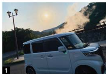
1 霧島温泉で西郷隆盛や坂本龍馬も癒された?! 2 今日の煙は薩摩半島方向か大隅半島方向か?

ところで、皆さんは車のナンバーをどう決めていますか？ 語呂合わせで310(さとう)とか194(いくよ)など名前を置き換える場合や、縁起のいい1122(いい夫婦)、2525(にこにこ)などがありますね。私は占いで決めました(笑)