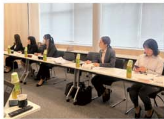
▲全ダイハツ労働組合連合会の皆さま