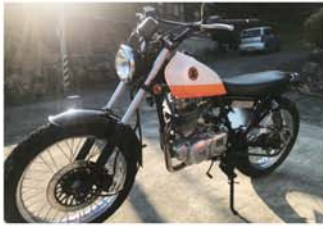
▲オヤジのはちよっと古いスズキの名車