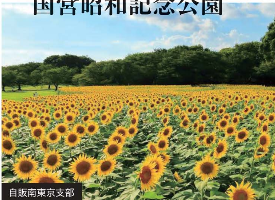
▲夏の見どころ、一面のひまわり。