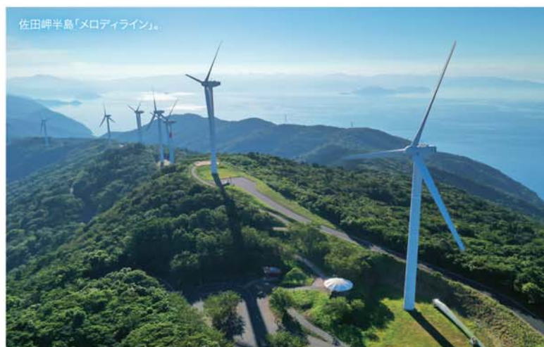
佐田岬半島「メロディライン」。

際に走って楽しんでみてください。また、岬の先端手前に観光案内所やカフェ・食堂、直売所が併設する「佐田岬はなはな」という施設があり、モニメントはインスタ映えすること間違いなし。「しらす食堂」では豪華なしらす丼を堪能することができます。