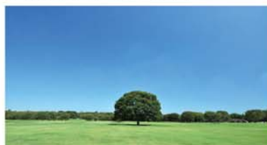
▲のんびり過ごせる「みんなの原っぱ」…東京とは思えない!