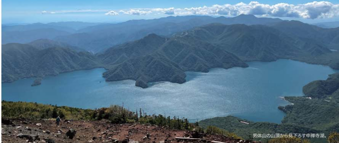
男体山の山頂から見下ろす中禅寺湖。

男 体山は、日光連山を代表する標高2486mの山です。780年代から山自体が信仰の対象となっていて、山頂には日光二荒山神社の奥宮があります。毎年7月31日には登拝祭が行われ、8月1日の深夜0時に多くの人が山頂を目指し登頂を開始します。男体山のふもとに広がる湖や滝、草原や湿原などは、男体山の噴火活動によりできたもので、山頂から見下ろす中禅寺湖は絶景!! 山頂まで登り約3時間・下山で約2時間半を要します。登り切った達成感で爽快ですが、下山すると膝が笑っています(笑笑)。