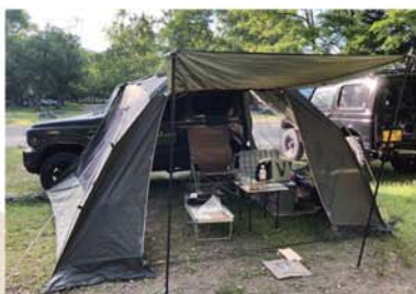
▼ジムニーにカーサイドタープを付けてカメラ。

子どもがまだ小さい頃は、家族で出かけていましたが、子どもも大きくなり、去年から本格的にソロキャンプを始めました。北海道は湖がたくさんあり、そこに隣接するキャンプ場もたくさんあります。湖を眺め、波の音を聞きながら最高の時を過ごしています。洞爺湖にあるキャンプ場に行ったときは、夕暮れとともに対岸にある温泉街から花火が上がりが始めました。花火自体は小さかったのですが、星空と湖面と相まって、忘れがたい情景を見せてくれました。このように、最近ではキャンプ場が綺麗になり、ルールもしっかりしてきているので、安心して非日常に浸れます。これからもいろんな湖畔キャンプを楽しみたいと思いましたが、これまで泊だけだったので、連泊にも挑戦したいですね。