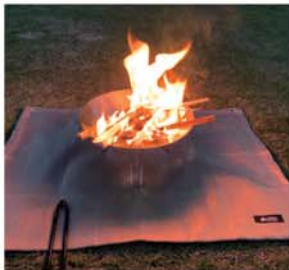
▲今日は晴天。月夜が楽しみです。焚火、カレー、そして一杯...