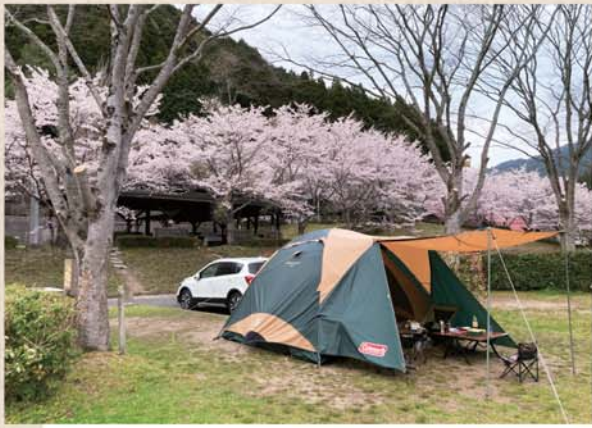
◀キャンプノウハウは災害時にも活かれますよ。P.S.キャンプでの写真が少ないと言われるのですが、撮るのも忘れて夢中になっているのです。

ウチは家族で出かけるので、設備が充実しているキャンプ場を選びます。場所によっては近くに温泉があったり、道の駅が併設したりするので、キャンプ以外も楽しめます。テント泊もしますが、個人的にストレス無く行きたいので、天候によってはロッジやコテージを利用することもあります。キャンプの魅力は、やはり非日常感。気分転換にはぴったりで、屋外での料理は何でも美味しく感じますね。ウチはグループでのデイキャンプに参加するのが始まりで、仲間いろいろな教授頂きながら自分のキャンプスタイルや道具が定まってきました。これからキャンプを始める人は、レンタルの道具を使ってから好みを決めるのがオススメ。昨年、スベシアベースを購入したので、オートキャンプで活用すべく計画中です。