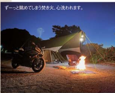
ずーっと眺めてしまう焚き火、心洗われます。

もう、仕事以外にはキャンプのことばかり考えてます。ベタですが、始まりは、娘と一緒に見に行った映画の「ゆるキャン」です。初めて行ったのが、「ふもとばら」という有名なキャンプ場。そしてバイクでのキャンプ場入りも初めてだったため、緊張していました。見よう見まねでなんとか嬉しかったこと、他のキャンパーのサイトを見ては興奮したことを憶えています。また、夜に富士山をバイクと一緒に見たことも、普段、なかなかできない贅沢でした。以来、バイクでソロツーリングをして、絶景の中、コーヒーを飲んだり焚き火をしたりして、贅沢を満喫しています。そして、来年は勤続年数10年のリフレッシュ休暇を取る予定なので、北海道にキャンプツーリングをしたいと思っています。