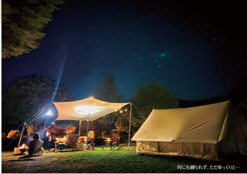
何にも縛られず、ただゆっくりと…