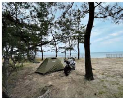
日常のあたりまえが、キャンプでは贅沢に変わる。