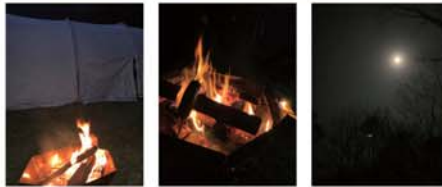
▲主に有料サイト利用。手入れが行き届いていてトイレも綺麗。たき火マジック。あっという間に時間が過ぎていきます。

ゆっくりしたいときはお弁当を買ったりして、たき火にぼーっとあたりながら過ごしています。そして、ゆっくり眠って迎える朝、白んでいく中での朝食は言葉にし難い魅力があります。でも、時には失敗も。朝、好天で出発したのに、夜、寝袋の中で凍えながら目覚めると、外は薄っすらと雪が積もっていてビックリなんでも、それ以降は、きちんと天気予報を見て出かけるようにしています。これまでに、高知県内だけの