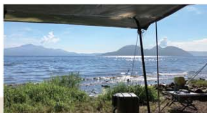
▲北海道ならではの映えスポット。

子どもがまだ小さい頃は、家族で出かけていましたが、子どもも大きくなり、去年から本格的にソロキャンプを始めました。北海道は湖がたくさんあり、そこに隣接するキャンプ場もたくさんあります。湖を眺め、波の音を聞きながら最高の時を過ごしています。洞爺湖にあるキャンプ場に行ったときは、夕暮れとともに対岸にある温泉街から花火が上がりが始めました。花火自体は小さかったのですが、星空と湖面と相まって、忘れがたい情景を見せてくれました。このように、最近ではキャンプ場が綺麗になり、ルールもしっかりしてきているので、安心して非日常に浸れます。これからもいろんな湖畔キャンプを楽しみたいと思いましたが、これまで泊だけだったので、連泊にも挑戦したいですね。