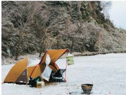
▲冬キャンプもやっています。