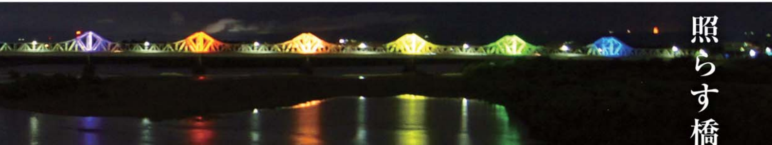
2022年7月ごろ、土手からの撮影