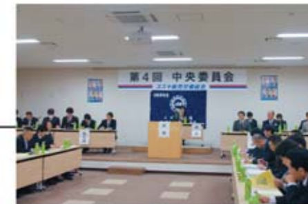
▲昨年2月に実施した「第4回中央委員会」の様相