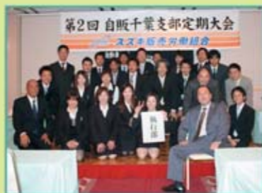
自販千葉支部 組合役員の皆さん

勤務管理の徹底!!これに尽きます。会社側も組合員も勤務管理の本来の意味を理解しましょう。スズキの繁栄のため、徹底的にやりますよ!!