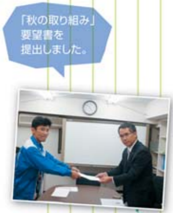
「秋の取り組み」 要望書を 提出しました。