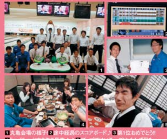
1 丸亀会場の様子 2 途中経過のスコアボード 3 第1位おめでとう!! 4 シャブシャブすき焼き最高!! 5 アップではいチーズおもわず目を...