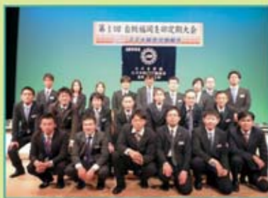
自販福岡支部 組合役員の皆さん