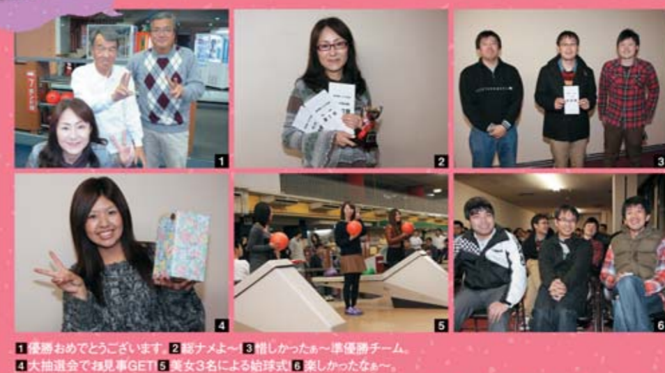
1 優勝おめでとうございます。2 部活よ~ 3 惜しかったあ~ 準優勝チーム。 4 大抽選会で抽選券GET! 5 美女3名による始球式! 6 楽しかったなあ~