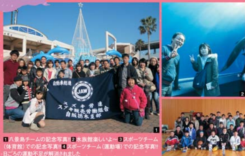
1 八景島チームの記念写真!! 2 水族館楽しいよ~ 3 スポーツチーム(体育館)での記念写真!! 4 スポーツチーム(運動場)での記念写真!! 日ごろの運動不足が解消されました