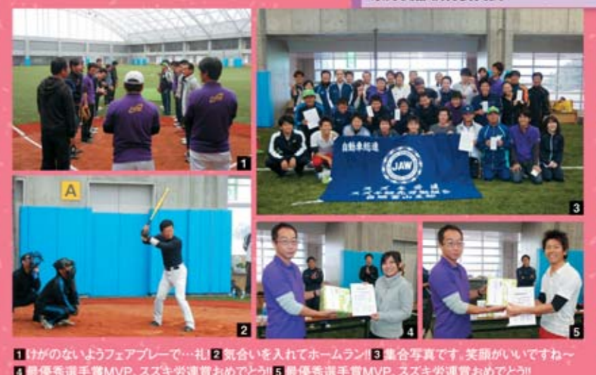
1 けがのないようフェアプレーで...礼 2 観戦を入れてホームラン! 3 集合写真です。笑顔がいいですね~ 4 最優秀選手賞MVP、スズキ労連賞おめでとう!! 5 最優秀選手賞MVP、スズキ労連賞おめでとう!!