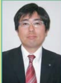
杉田支部執行委員長

組合が行っている活動を組合員全員に知ってもらえるような活動をしていきたいと思っています。困ったことや問題を話し合い解決していくことで、会社と組合でより良い関係を築き、社員全員が楽しく元気に仕事ができる活発な自販福岡支部になれたらいいなと思っています。