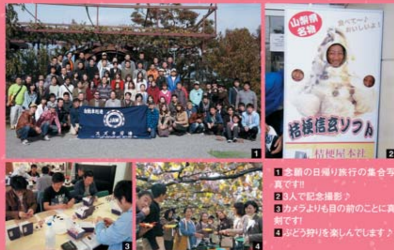
1 念願の日帰り旅行の集合写真です!! 2 3人で記念撮影! 3 カメラよりも目の前のことに真剣です! 4 ぶどう狩りを楽しんでいます!