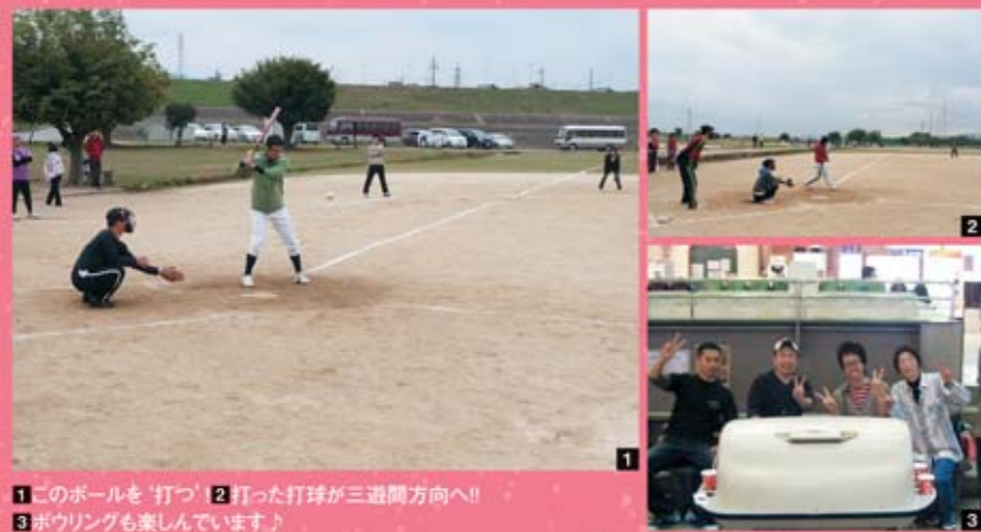
1 このボールを「打つ」! 2 打った打球が三遊間方向へ!! 3 ボウリングも楽しんでいます。