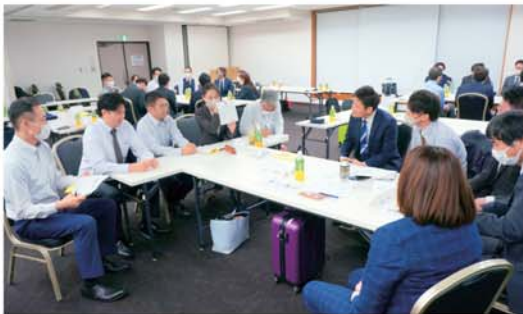
▲模擬労使交渉の様子。「会社」を演じて何か分かった?変わった? 課題解決に何が必要なのかを議論し共有する

主に労働諸条件改善の取り組みや総合生活改善の取り組みをはじめとした賃金対策部長としての役割を学びました。この研修の様子を想像すると、お堅い話を延々と聞くようなイメージを持たれるかもしれませんが、しかし、まったくそんなことはありません。