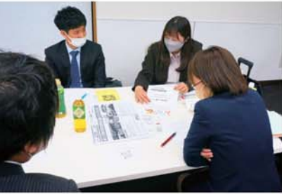
▲支部ニュースを共有しています。