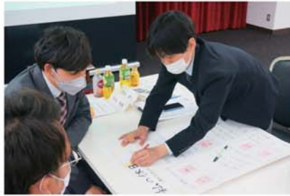
▲グループワークの様子。