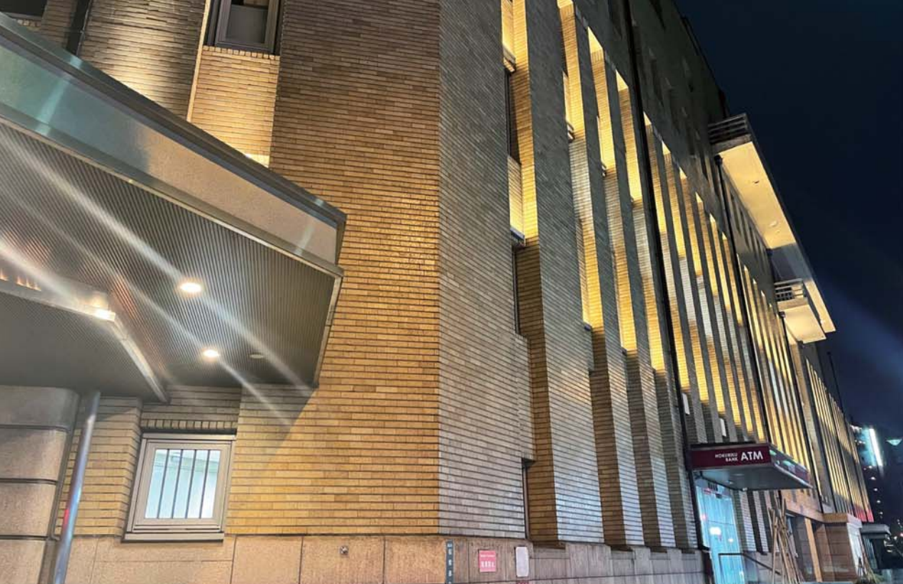
▲「イ」は大文字で富山電気ビルディング。テレビドラマ「不毛地帯」のロケ場所にも使われたほど実にドラマチックな雰囲気。ここで結婚式を挙げれば苦難を乗り越え末永く幸せが続く？