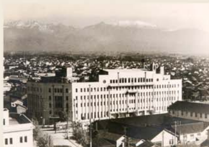
▲立山連峰を背景にした電気ビルの古い写真。

市街地の99.5%(全国一の焼夷率)が焼失したが、電気ビルは奇跡的に難を逃れ、建設当時の外観を保った」と記されています。戦後は進駐軍に接収され司令部が置かれたが、1952年から復元のシンボルとなって富山の発展を支え、現在もオフィスビルとして電力関連の企業・団体が入居するほか、レストラン、結婚式場、ビアホールも営業する集いの場となっています。外観、内観のあちこちに当時の雰囲気が残る、真ちゅう製の郵便ポストや電気時計など今も使われている設備が残ります。2018年には歴史的建造物として国の登録有形文化財に登録されましたが、これからも現役で活躍してほしいと思います。