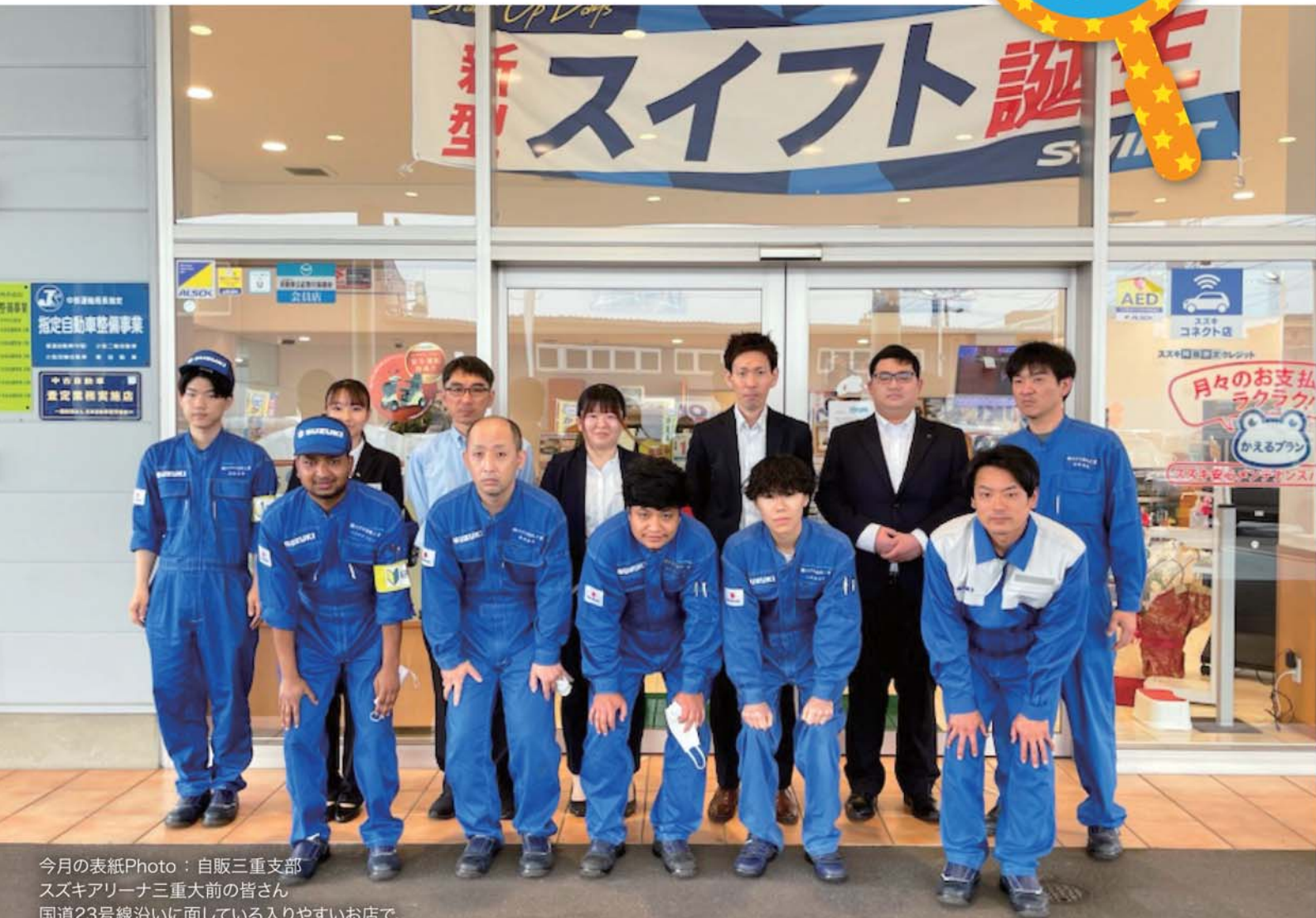
今月の表紙Photo：自販三重支部 スズキアリーナ三重大前の皆さん 国道23号線沿いに面している入りやすいお店で、 営業5人、サービススタッフ7人の12人で運営しています。