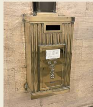
▲今も使われている真ちゅう製の郵便ポスト。