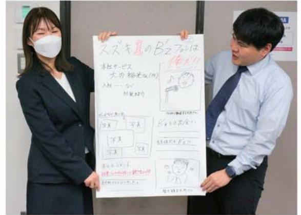
▲ノウハウを得てステキなニュースが完成。自由な発言と柔軟な発想でアイデアが発展。