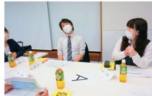
▲賃金対策部長会議の一コマ。

りません。部長たちが労使に分かれて行うグループ対抗の模擬労使交渉は、写真を見ても分かるように非常に盛り上がりました。自分たちの想いを伝えるだけでなく、「会社側の考え」を知り、交渉することへの気付きになりました。