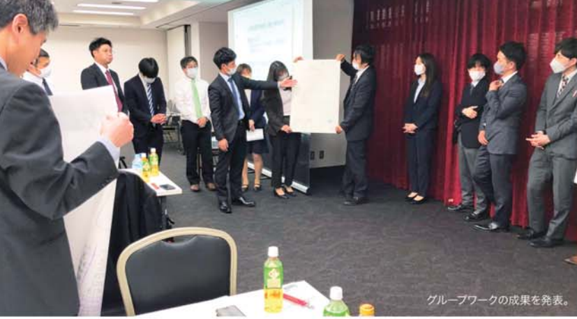
グループワークの成果を発表。

支部ニュースをはじめとした広報活動をいざ、やってみようと思っても、とても難しいものです。そこで、今回は j. union (株)より在任講師を招いて広報スキルアップを講義いただきました。その後のグループワークでは、各自持ち寄ったアイデアを出し合いながら、架空の支部ニュース制作に挑戦。完成した紙面はどれも甲乙つけがたい出来栄でした。最後に参加者全員でフィードバックを行い、良いアイデアをたくさん持ち帰りました。