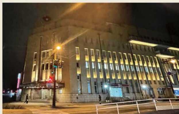
◀富山は公共交通を市電にシフトして成功している電車王国。レトロ車両や次世代型路面電車LRT(ライト・レール・トランジット)が走る。