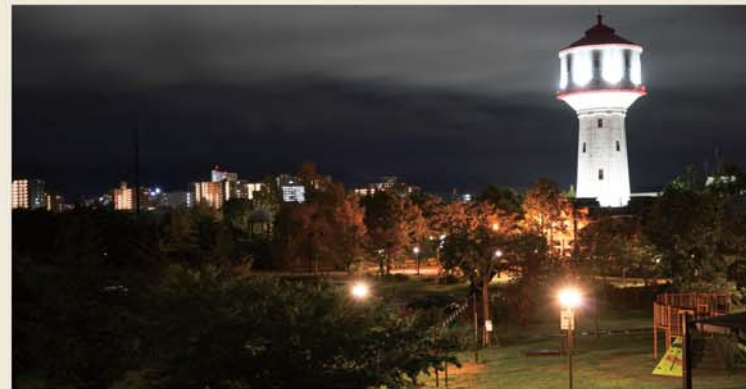
▲21時までライトアップ。