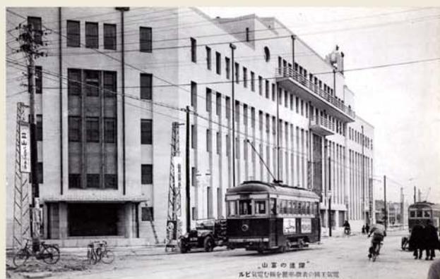
▲歴史を感じる古い写真。周辺の景色は変わっても、富山電気ビルの佇まいはほとんど変わっていません。