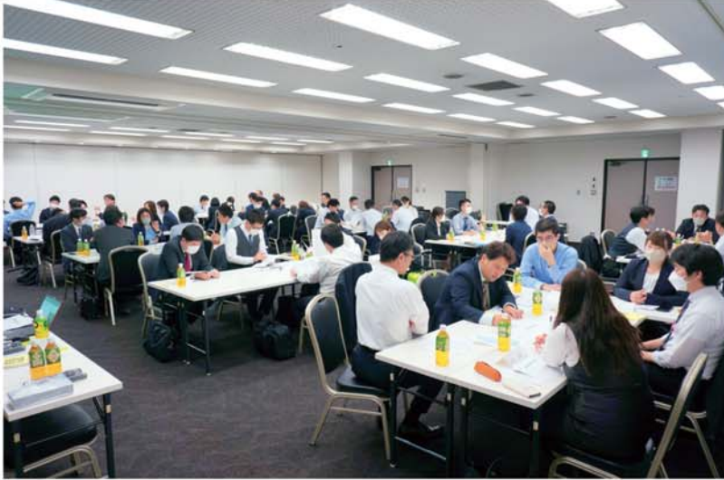
▲賃金対策部長会議の全体風景。

4月16日から18日の3日間にわたり、大阪会場にてスズキ販売労働組合の全52支部に置かれている3つの専門部、「賃金対策部」「福祉対策部」「広報部」の部長会議が開催され、講習やグループワークなどを通してのスキルアップが図られました。今後、より一層支部活動を盛り上げてくれることでしょうか！