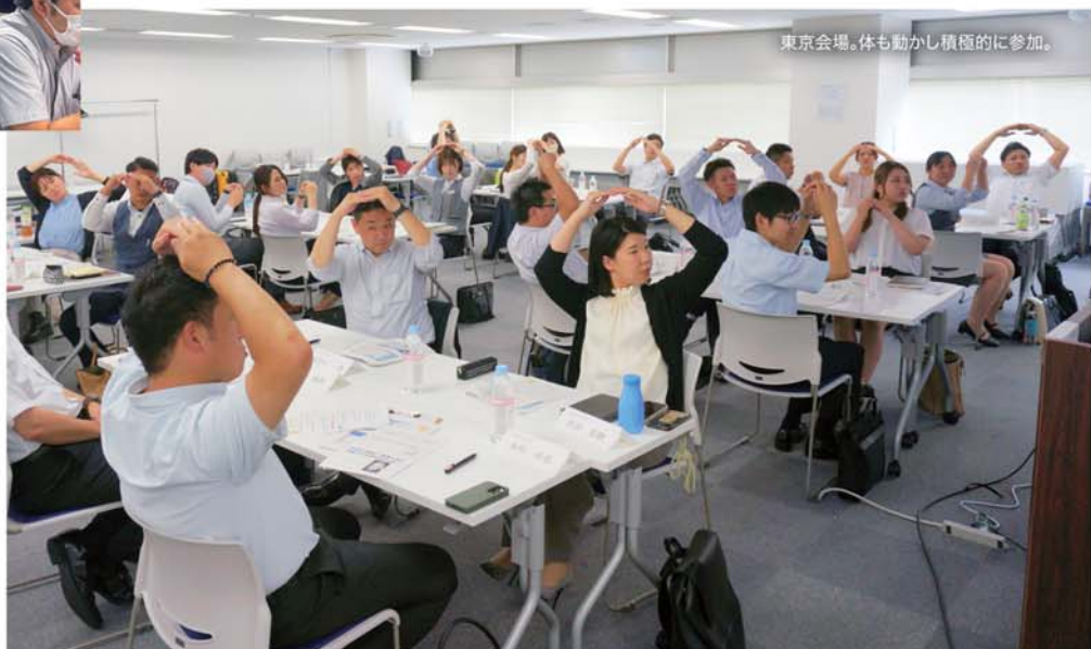
東京会場。体も動かし積極的に参加。