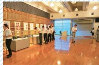
▶ 「貴族院」は明治憲法下で衆議院とともに帝国議院を構成した立法機関。