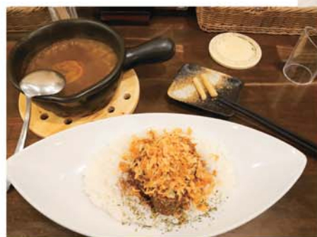
近江屋清右衛門 人気NO.1 「自家製欧風とろとろ牛バラカレー」