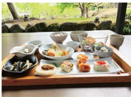
cafe たねの隣り「隣のごはん」