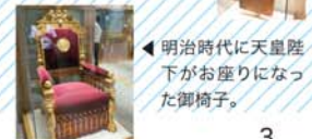
◀ 明治時代に天皇陛下がお座りになった御椅子。