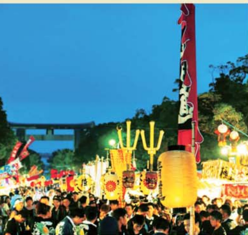
▲祭り屋台の定番、りんご飴やイカ焼きなどの食べ物、金魚すくいや射的など娯楽屋台も充実。さらに、今では見られなくなったお化け屋敷や見世物小屋なども出店する。