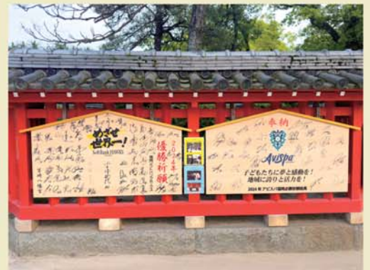
▲スポーツ関係者はもちろん、政治家や、経営者・自営業の人々も多く訪れ開運勝利を祈願。