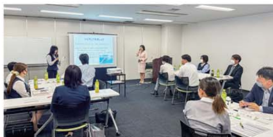
▲福岡会場。相手の言うことを否定せず、耳も心も傾けて話を聴く。