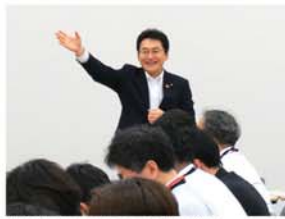
▲活動を報告するいそぎ議員。