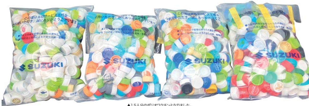
▲1.5人分のポリオワクチンとなりました。