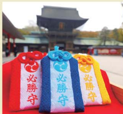
▲必勝お守り1000円～、個人の必勝祈願は5000円(要予約)

※(5月の博多どんたく港まつり・7月の博多祇園山笠・9月の放生会) す。現在では、地元プロ野球球団のソフトバンクホークスやJリーグのアビスパ福岡などが毎年、必勝祈願を行っています。また、9月には、博多の三大祭り*の1つ、「放生会(ほうじょうえ)」が開催されます。放生会とは日頃、私たちが生きるために命をいただいている生き物を供養し、感謝を捧げる神事であり肉食や殺生を戒める儀式です。全国各地の神社で行われていますが、こゝ宮崎宮の放生会は千年以上続く重要な祭典で、7日間の期間中は参道一帯に約500軒もの露店が立ち並び、100万人の人が訪れる九州一の秋祭りです。「放生会」の呼び方は、全国的には「ほうじょうえ」が正式のようですが、地元福岡では「ほうじょうや」と言いますので、福岡の人と話すときは使い分けてみてください。