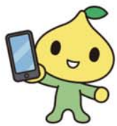
公式キャラクター ピットくん