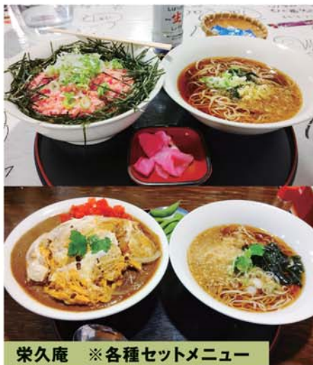
栄久庵 ※各種セットメニュー

デカ盛りの有名店。普通盛りでもかなりの量。普通の人はこれでお腹いっぱい。上はきりがなく、プロの大食いが集まります。