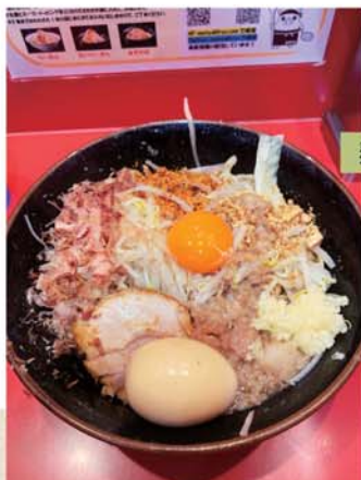
麺屋 桐龍「ませそば」

最高に美味しく、定期的に食べに行ってます。冷凍のお取り寄せもできます！とにかく食べてみて下さい。