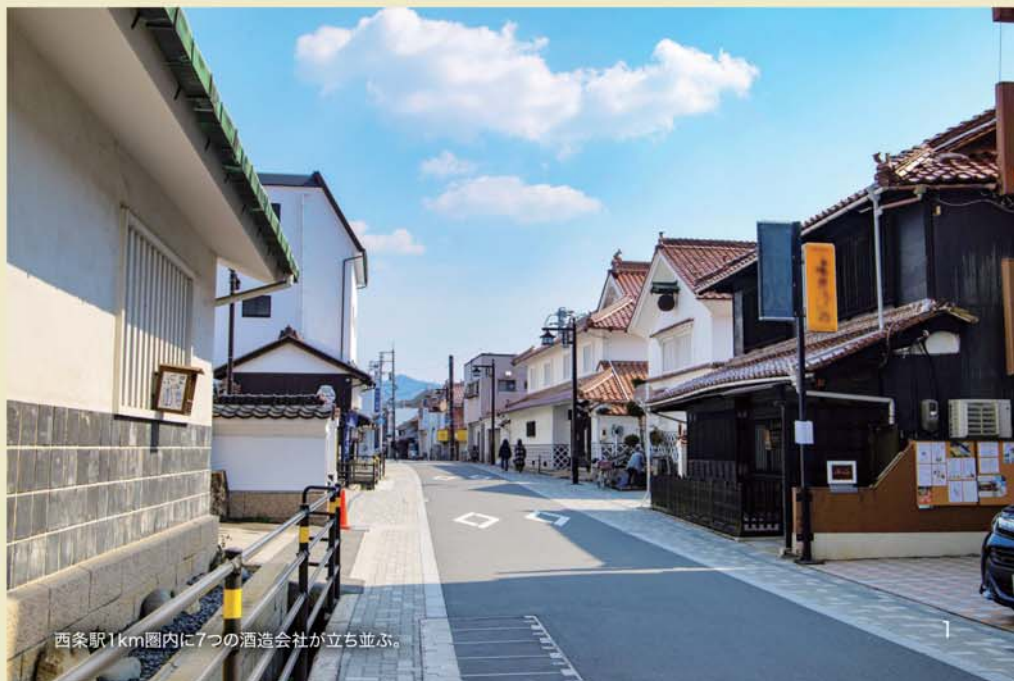
西条駅1km圏内に7つの酒造会社立ち並び。

※お出かけ先でお酒を楽しむときは「飲酒運転をしない・させない・許さない」の厳守をお願いします。