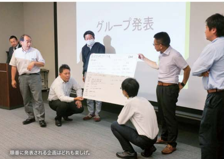
順番に発表される企画はどれも楽しげ。