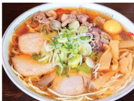
中華そば末広「スタミナラーメン」

山形県新庄市名物の鳥モツラーメンの老舗、中華そば末広さんの鳥モツラーメンは「スタミナラーメン」という名前で、写真はトッピング全部のせ、特大のスタミナラーメンです。鳥モツの具はいろんな食感が楽しめて美味しいですよ！