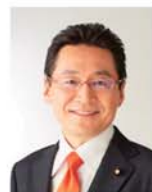
国民民主党 参議院議員 いそぎてつじ

*組織内議員：業界の実情に詳しく、組合員の思いを正しく政治の場に届けてくれる、組合員が支える議員さん。