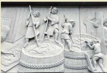
▲西条駅には、酒蔵のイメージレリーフがあります。