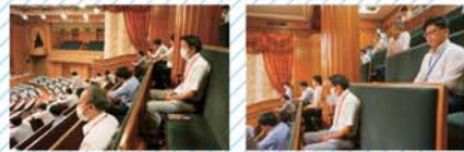
▶ 参観ロビーでは国会議事堂の歴史や国会の仕事を紹介している。