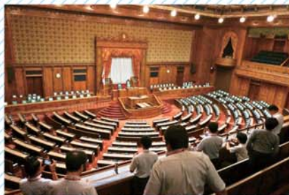
▲貴族院時代から継続して使用されている議場。国の未来を左右するさまざまな法案がこの本会議場で成立する。