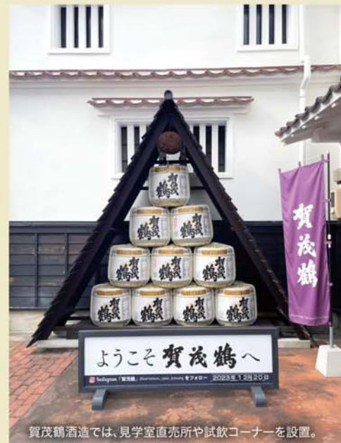
賀茂鶴酒造では、見学室直売所や試飲コーナーを設置。