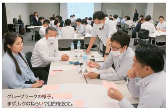
グループワークの様子。 まず、レクのねらいや目的を設定。