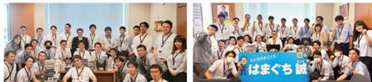
▲最後に2班に分かれ、組織議員事務所を訪問。両議員の活動と活躍をより身近に感じた一日。