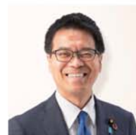
国民民主党 参議院議員 はまぐちまこと