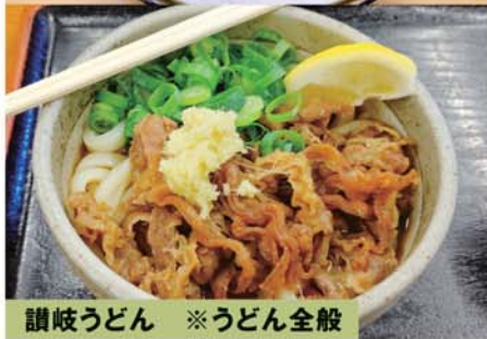
讃岐うどん ※うどん全般

年に2回程食べに行ってます。うどんのコシや太さ・ダシやしょうゆなどの食べ方・冷温の温度・たまごや肉などのトッピング・天ぷらやおでんなどのサイドメニューも美味しく楽しくサイコーです。写真は上から「がもう」「谷川米穀店」「綿谷」。