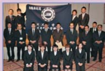
自販熊本支部 組合役員の皆さん

Q 地元のおすすめは… 宇都宮キヨザや佐野ラーメンなどはTVでよくとり上げられますが、意外とソバが美味しいのでおすすめです。また、足利フラワーパークという所の冬のイルミネーション時期は某テーマパーク以上に混雑するぐらい見応えあります。是非みにきて下さい!