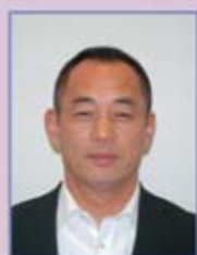
堀川支部執行委員長

Q これから力を入れて活動していきたいことは… 「働きやすい職場環境づくり」「魅力ある職場」を会社側と共に取り組んでいきたいと思っています。