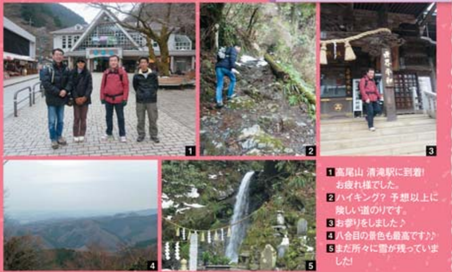
1高尾山 清滝駅に到着! お疲れ様でした。 2ハイキング? 予想以上に険しい道のりです。 3お参りをしました♪ 4八合目の景色も最高です!! 5まだ所々に雪が残っていました!