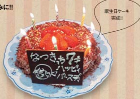
誕生日ケーキ完成!!

「こんなことに熱中してます!」「ねえ、聞いて!!」など皆さんの「MY BOOM(マイブーム)」をお届けするコーナーです。スポーツ、自慢のコレクションetc... 毎回、様々な「MY BOOM(マイブーム)」が登場します。次回の熱中人もお楽しみに!!