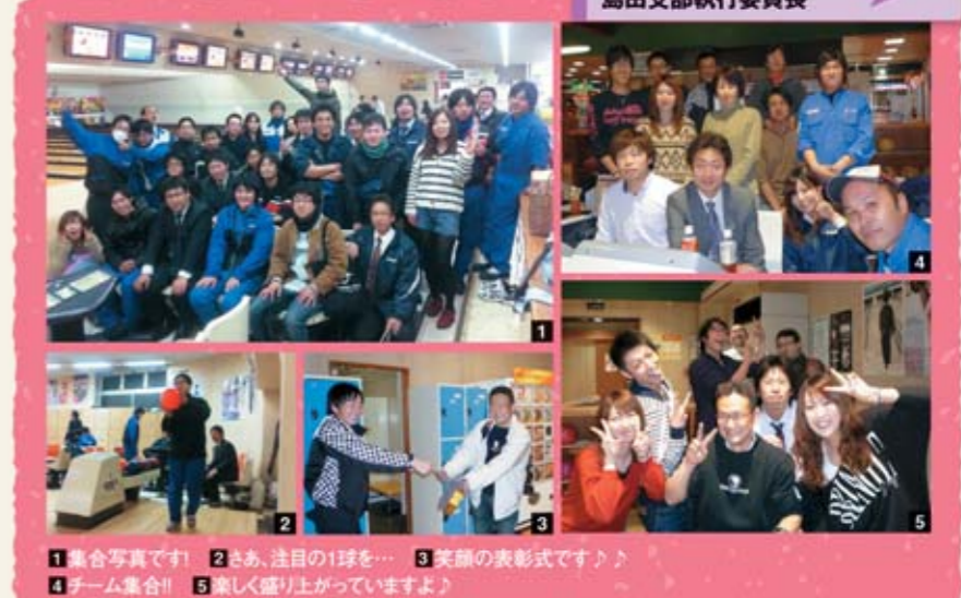
1集合写真です! 2さあ、注目の1球を... 3笑顔の表彰式です♪ 4チーム集合!! 5楽しく盛り上げていますよ!