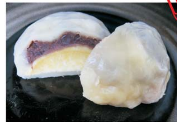
詳しくは「いきなり団子研究所」で検索!

「いきなり団子」とは熊本の郷土菓子であり、その由来は「お客様が突然いらしてもいきなり(すぐに)作れるから」というもので、由来からしておもてなしのお菓子です。皮が薄くてモチモチリ。とても上品な甘さのあんこ、ほっこりとしたお芋が絶妙に絡み合っしっとり美味しいスイーツです。