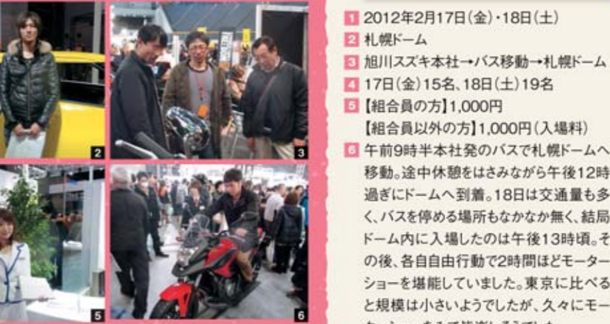
1会場前で記念撮影♪ 2記念撮影PART2♪ 3バイクに集中しています! 4乗り心地を確かめています。 5パンフレットをいただきました。 6バイクに乗りたいです!!