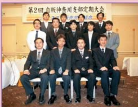
自販神奈川支部 組合役員の皆さん

最後に一言(または、お祈りします)。働きやすい職場にするために、やらなければならないことがまた沢山あります。執行部一丸となって取り組んでいきたいと思っておりますのでよろしくお祈りします。