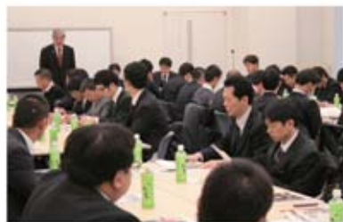
▲国政報告を行う、池口参議院議員

2013年2月6日(水)東京にてより政治に関する知識と感心を高め、組織強化活動の重要性を理解する為、政策制度研修会を開催しました。第6回中央委員会終了後、国会議事堂へ移動し研修会においては自動車総連組織内議員の直嶋正行参議院議員、池口修司参議院議員、古本伸一郎参議院議員よりお話を伺いその後、参議院議場など議事堂内を見学しました。この政策制度研修会で国政を身近に感じる事ができました。今後自動車業界出身の議員を通じて国政の場に私たちの「声」を届けて行きましょう。