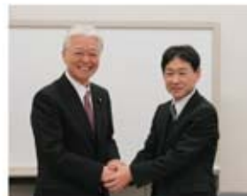
▲直嶋正行参議院議員と後藤中央執行委員長