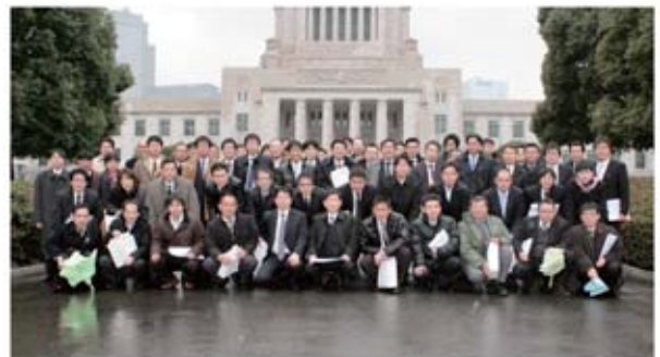
▲国会議事堂前にて