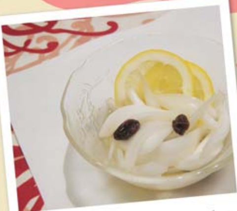
Instant pickles of spring onion