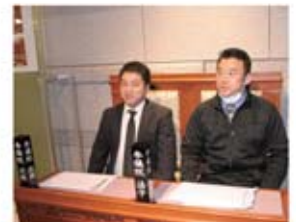
▲中川・富安参議院議員?