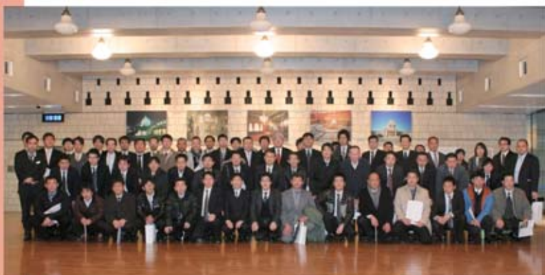
▲池口修次参議院議員と記念撮影