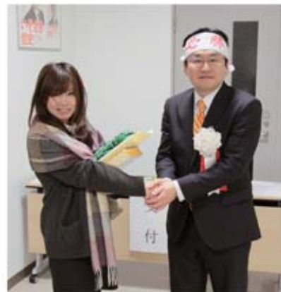
▲自販東海支部 大沢支部執行委員