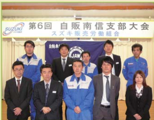
自販南信支部 組合役員の皆さん