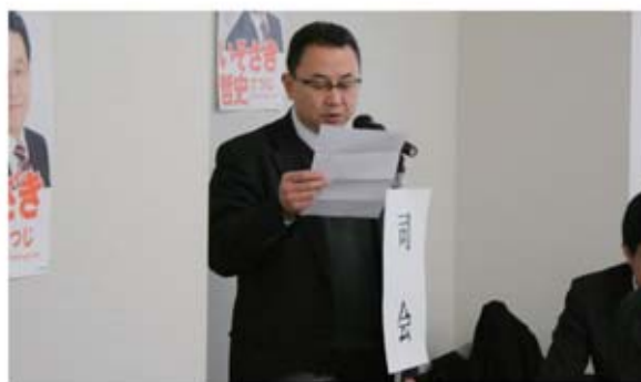
▲司会の自販湘南支部 塚支部執行委員長