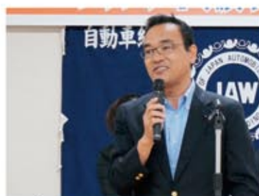
▲田口 章 静岡県議会議員