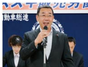
▲徳光 卓也 浜松市議会議員