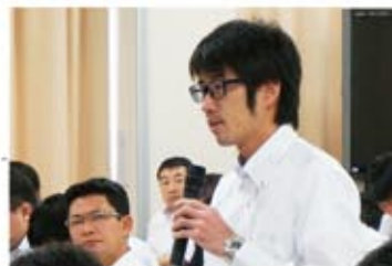
▲質問者 自販滋賀支部 里内支部書記長