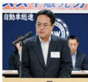
▲太田会計監査人(自販東海支部)