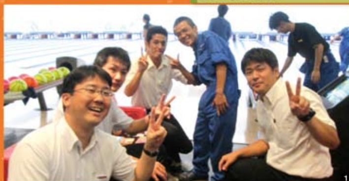
1 最高の笑顔です。 2 美人グループI 3 美人グループII