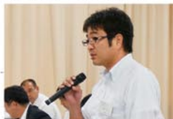
▲質問者 自販滋賀支部 猿喰支部執行委員長