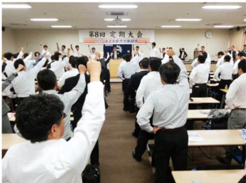
▲出席者全員で力強くガンバロー!