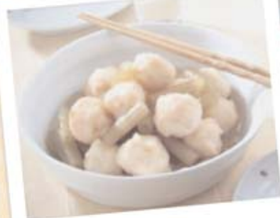
Butterbur and shrimp