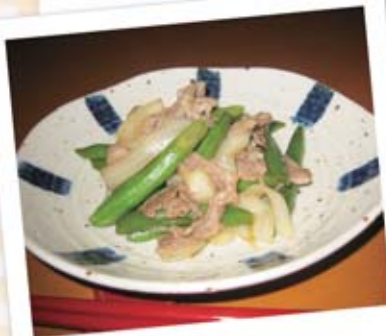
Simmered green beans