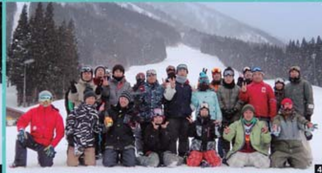
1,2 ジャンプがすばらしいです! 3,4 絶好のコンディションで楽しい1日でした。