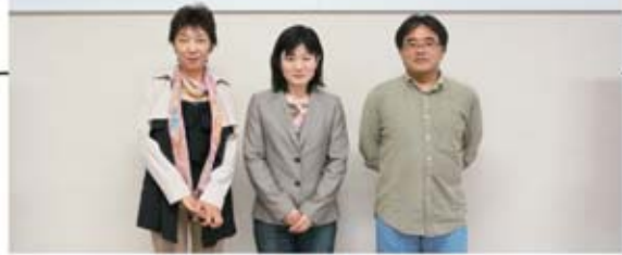
▲左から自販宮城支部 半澤支部書記次長、 自販群馬支部 塚越支部書記長、自販茨城支部 高橋支部書記長