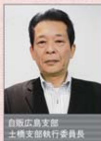
自販広島支部 土橋支部執行委員長