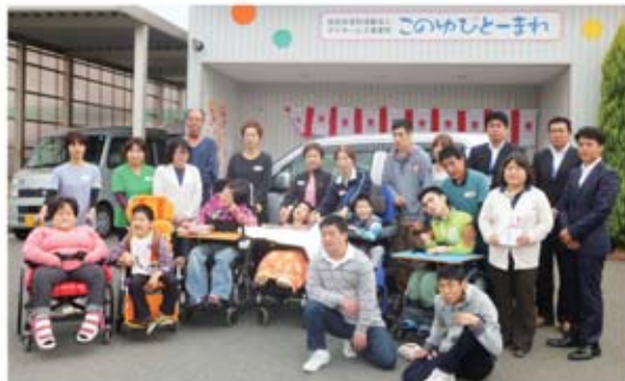
▲ワゴンR FXの前で記念撮影