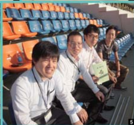
1 18日の応援メンバー 2 19日の応援メンバー 3 みんな速い、猛ダッシュ! 4 がんばれ〜!! 5 はりきって最前列、「応援がんばるぞ〜!!」