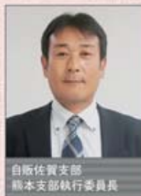
自販佐賀支部 熊本支部執行委員長