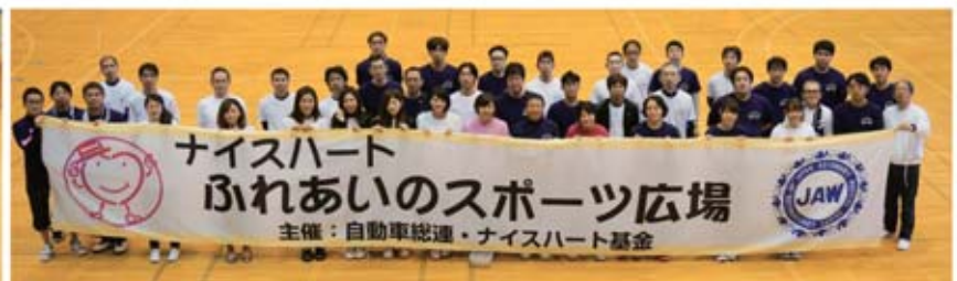
▲スズキ労連集合写真