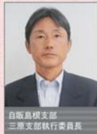
自販鳥根支部 三原支部執行委員長