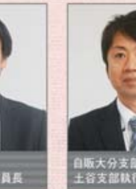
自販大分支部 土谷支部執行委員長