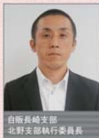
自販長崎支部 北野支部執行委員長