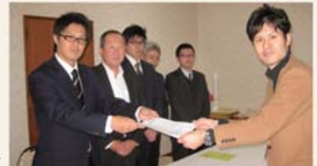
平成27年度自動車関係諸税に関する要望書提出▶