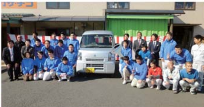
▲エブリイ JOINと記念撮影