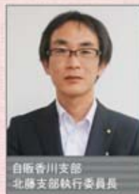
自販香川支部 北藤支部執行委員長