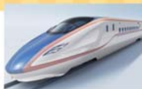
●3,14北陸新幹線 (かがやき)