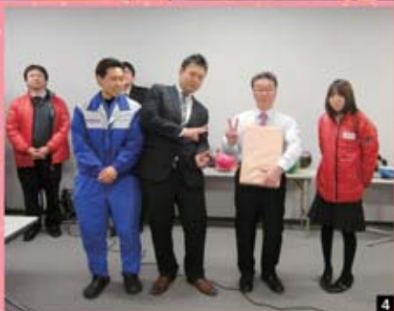
1 たくさんの社員の皆さんに集まっていただきました。 2 これから始球式が始まります。 3 入賞しました。 4 社長チーム、団体3位でした。