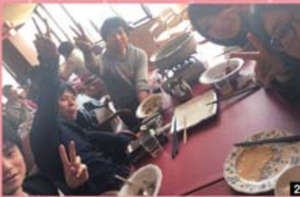
1 参加者の記念写真 2 おいしかったー!!