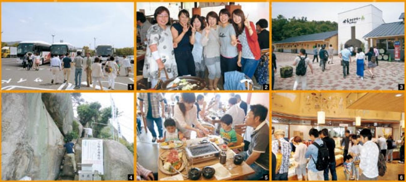
1 みんな合流。さあ～出発!! 2 仲良く(´▽`)/ 3 会場到着。いっぱい食べるぞ～ 4 修行僧?? 5 家族の方も参加いただきました 6 何にしようかな～、悩むな～