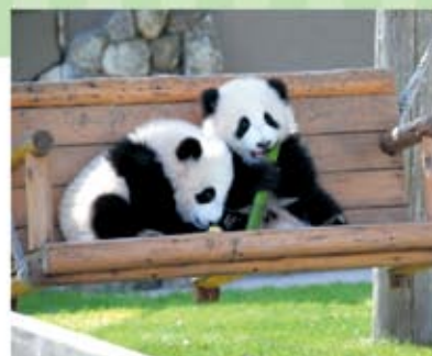
アドベンチャーワールド 双子のパンダ

梅干しや有田ミカン・桃や柿と言ったように果物がとてもおいしい和歌山和歌山ラーメンもお店がたくさんあり、そこを教えてくれるラーメンタクシーも走っています。さらにパンダもたくさんいます。温泉もたくさんあります。高野山も熊野古道も白浜も。県のイメージは地味ですが見どころはたくさんあります!ぜひ和歌山へ!