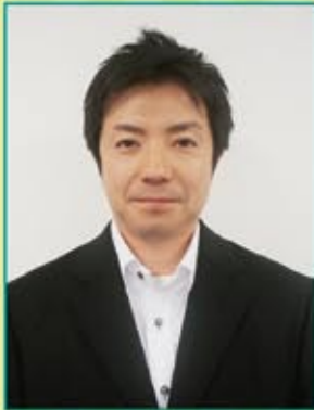
上田支部執行委員長

毎回3支部、全国の「スズキ販売労働組合」支部の委員長にご登場いただき、様々な情報提供をさせていただくコーナーです。