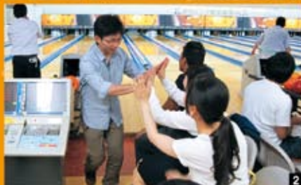
1 2 (前橋会場) やったぁ、ストライク! 3 (高崎会場) みんなで盛り上がってます! 4 とても楽しかったよ。 5 優勝しました! 6 7 8 賞品もらいました!