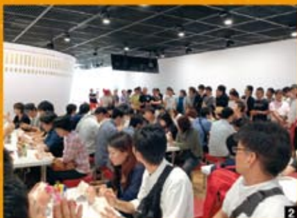
2 マイカップヌードルたいま製作中