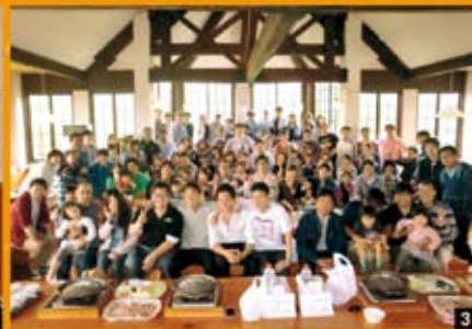
3 これからみんなでジンギスカン!