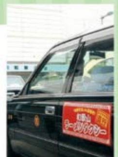
和歌山ラーメンタクシー