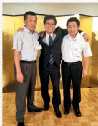
自販京都支部 6/13 京都地協にて