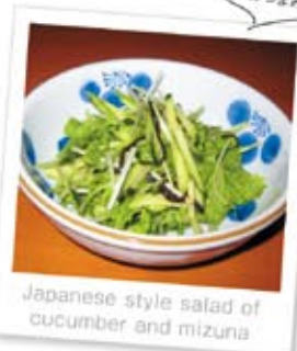
Japanese style salad of cucumber and mizuna