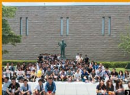
3 参加者全員で記念撮影