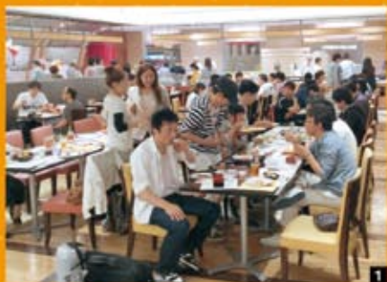
1 ランチバイキング堪能中

5 京都支部のレク、6月10日日清カップヌードル記念館に行ってきました。その後ランチバイキングに行って懇親会を開催しました。参加者がそれぞれマイカップヌードルを作り、バイキングで食べまくり、お腹いっぱいの日でした。