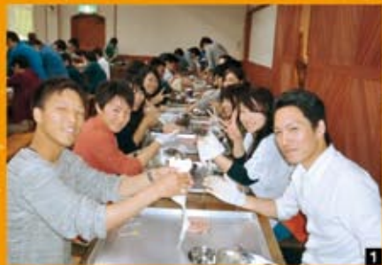
1 みんなでソーセージ作成中!