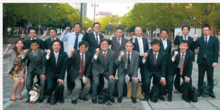
自販神奈川支部 4/23 神奈川地協副議長会議にて