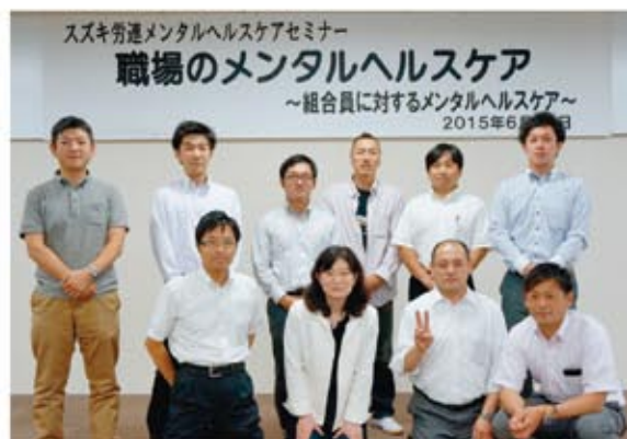
▲参加いただいた支部の皆様