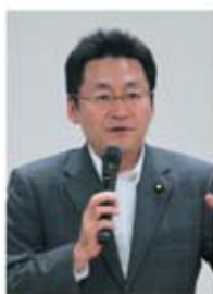
▲磯崎 哲史 参議院議員