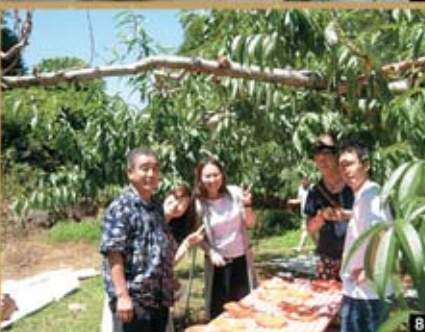
1 桃狩り(でも暑いよー) 2 ハーブのエキスでお肌すべすべ 3 4 ホテルで食べ放題 5 桔梗屋工場内 6 ブルーベリーも試飲中 7 先ほどのハーブエキスがお得なお値段で 8 桃おいしいです