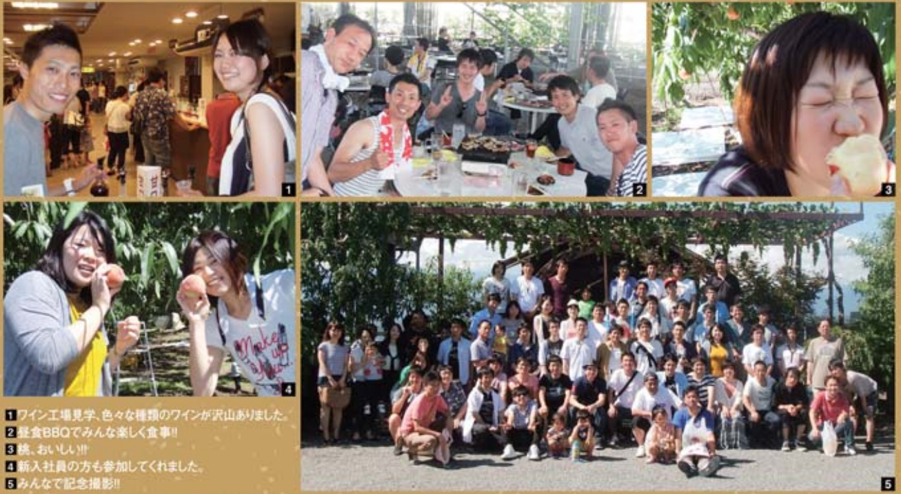
1 ワイン工場見学、色々な種類のワインが沢山ありました。 2 昼食BBQでみんな楽しく食事!! 3 桃、おいしい!! 4 新入社員の方も参加してくれました。 5 みんなで記念撮影!!