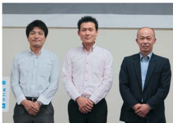
▲参加いただいた支部の皆さん