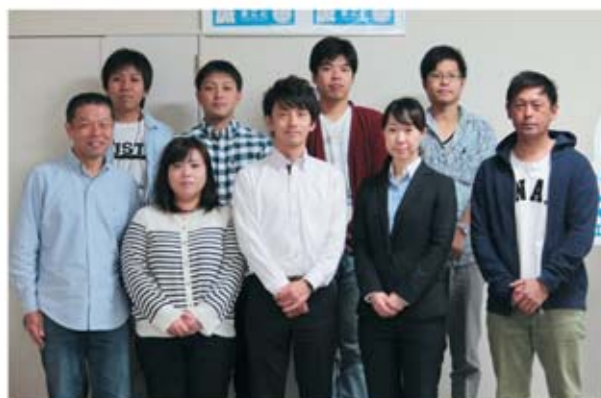
▲参加いただいた支部の皆さん