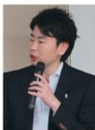
▲自動車総連 中野部長