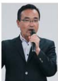
▲田口 章 静岡県議会議員