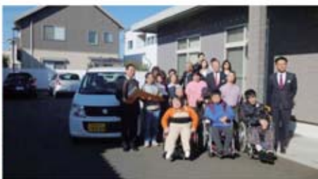
▲ワゴンR FXと記念撮影