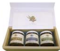
▲しらゆり荘で作っている商品