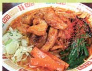
●ホルモンラーメン

旭川といえば、旭山動物園が全国的に有名になっていますが、今回は地元ならではの隠れた食べ物をおすすめします。特に、ホルモンラーメン(通称モルメン)がおすすめです。実際に食べて頂いた方は、おすすめした理由が分かると思います。また9月には、JR旭川駅前広場から七条緑道までの通りが食べ物市場と化した「北の恵み 食べマルシェ」が開催されます。グルメ好きにはたまらないイベントです。是非、旭川に来て下さい!