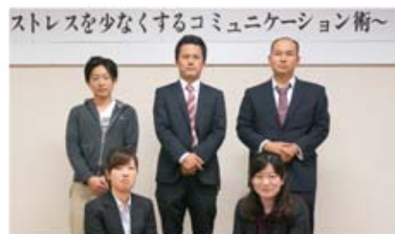
▲参加いただいた 支部の皆様