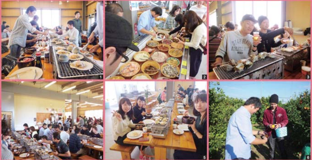
1 ハマグリ、ホタテ!浜焼き♡浜焼き、みんな夢中です 2 好きなお魚をたっぷりのせて、自分だけの海鮮丼作成中! 3 副委員長、浜焼きに、満面の笑み(〇)おいしいよ 4 初、浜焼きツアー!満足・満腹~! 5 楽しかったですよみんなも、参加してね 6 食後のデザート、みかん狩り!こっちのみかんが、甘いね!