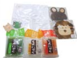
▲わくわく祇園'Sで作っている商品