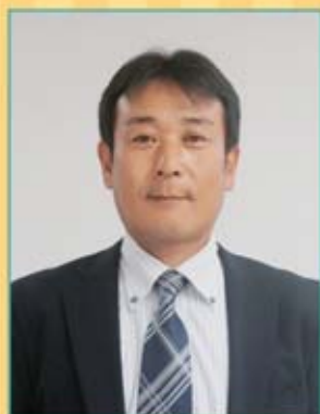
熊本支部執行委員長

自販佐賀支部の熊本です。今期で2年目です。不慣れな事もまだまだ多い中の活動ですが組合員の方々の声に耳を傾けていき、みんなが生き生きと働ける環境作りのため頑張ります。前期では2回レクリエーションを行いました。今期ももっと皆さんに参加して楽しんでもらえるよう取り組んでいこうと思います。