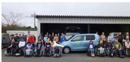
▲ワゴンR FXと記念撮影