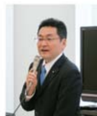
▲磯崎哲史参議院議員