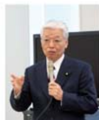
▲直嶋正行参議院議員