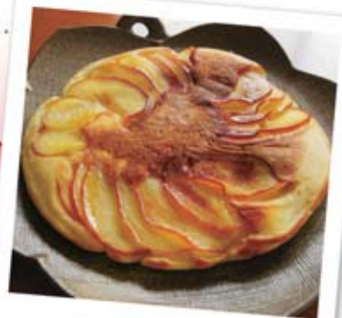
Apple hot cake