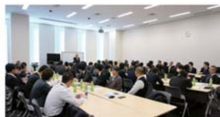
▲自動車総連組織内議員と意見交換の様子