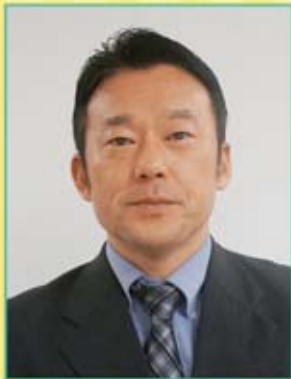
富安支部執行委員長

全国の「スズキ販売労働組合」支部の委員長にご登場いただき、様々な情報提供をしていただくコーナーです。