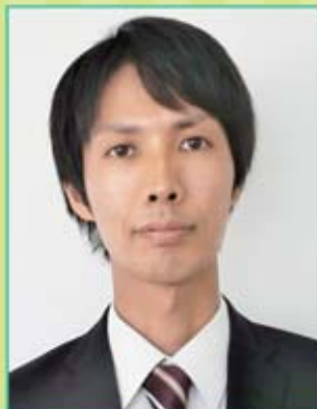
渡慶次支部執行委員長