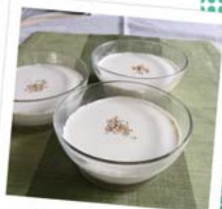
Easy sesame pudding