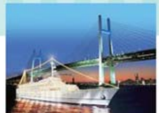
●横浜ベイブリッジ