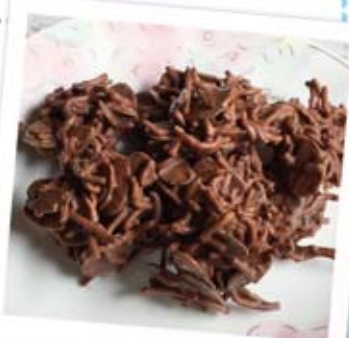
Chocolate to baby noodles