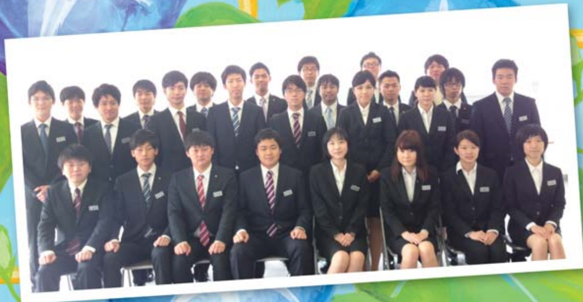
自衛中部支部の新入社員の皆さん