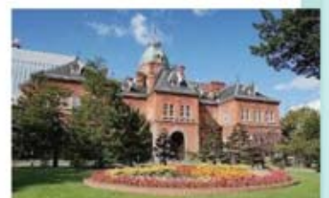
●港の見える丘公園