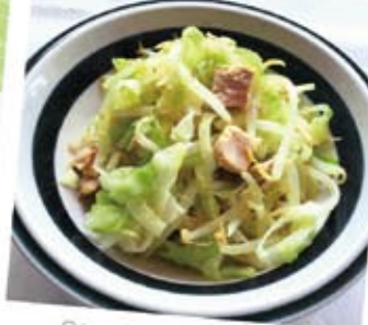
Steamed cabbage in the range