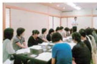
▲ライフプランセミナー