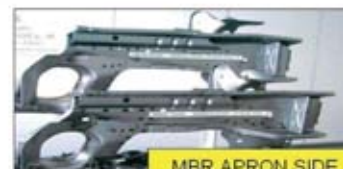
MBR APRON SIDE