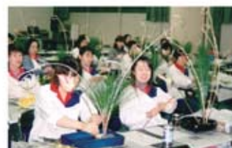
▲フラワーアレンジメント教室