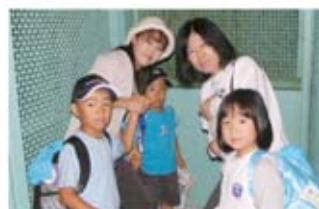
▲バスハイク(会社共催)

主な組合行事としては、8月に会社と共催で日帰りバスハイクを行っています。これには、2コースを設定し、各年代の組合員とその家族が参加しやすいようしています。また、女性委員会主催でフラワーアレンジメント(生け花)教室を毎年開催しています。これは年末(会社最終稼働日)に行い、各家庭の玄関などに飾れるようにしており、大変好評を頂いています。そのほかに、ライフプランセミナーやパン教室等を行っています。組合役員には年に1回スズキ労連、全労済、ろうきんから講師を招き、宿泊研修を行っています。