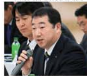
▲自販北海道支部 東支部執行委員長