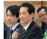
▲自販広島支部 土橋支部執行委員長