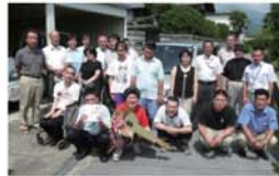
車両寄贈(自販滋賀支部)