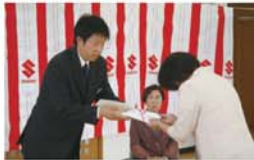
車両寄贈(自販奈良支部)