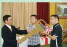
車両寄贈(自販兵庫支部)