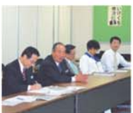
国内営業部との意見交換会 (会社側)