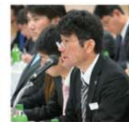
▲昇中央執行委員長