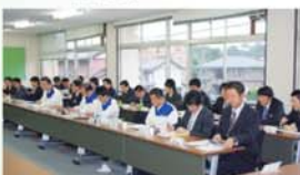
国内営業部との意見交換会(組合側)