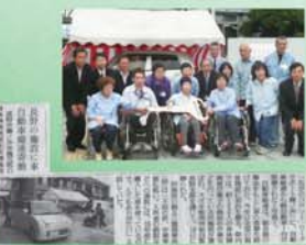
車両寄贈(自販長野支部)