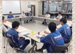
▲執行委員会の様子