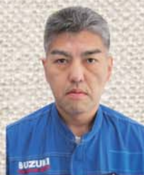
報告者：村山副支部執行委員長