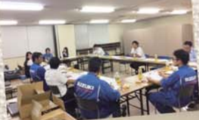
▲執行委員会の様子