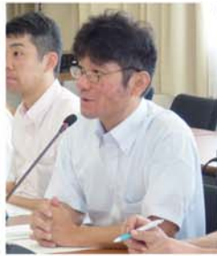
▲昇中央執行委員長