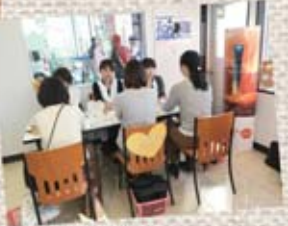
▲POLAさんの 出張ハンドマッサージ