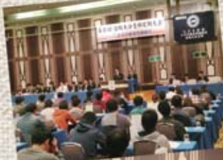
◀支部定期大会の様子

おんせん県大分には是非お越しください。別府、湯布院、九重、長湯、お勤めの温泉がいっぱいです。大分駅の上にも温泉施設がございます。必要な物は全て揃っているので手ぶらで大丈夫です。大分市内が見渡せます。