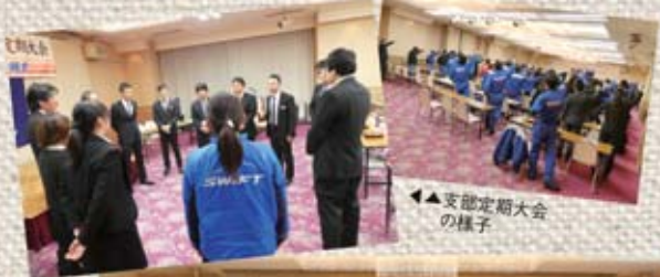
▲支店定期大会の様子