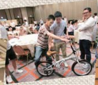
▲レクでの ビンゴ大会