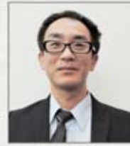
自衛香川支部 北藤支部執行委員長