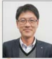
自衛京業支部 菅内支部執行委員長