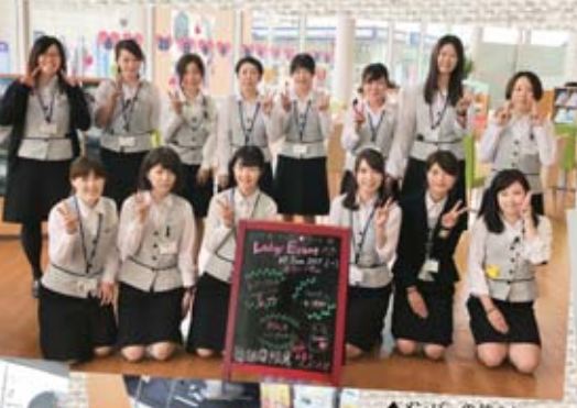
▲メンバーの皆さん