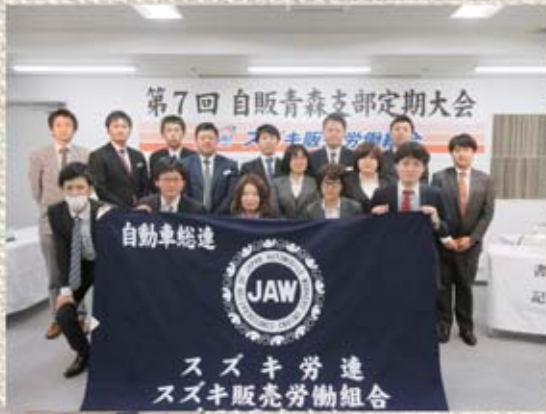
▲支部執行部 ▲執行委員会の様子