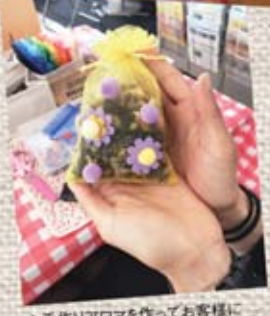
▲手作りアロマを作ってお客様にお配りしました!