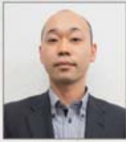
自衛新潟支部 曾我支部執行委員長