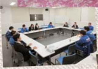
▲支部執行部 ▼執行委員会の様子