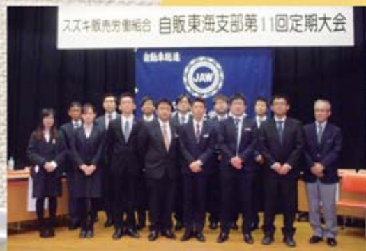
入スキ販売労組組合 自販東海支部第11回定期大会