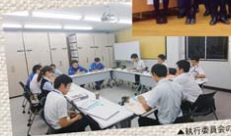
▲執行委員会の様子

専門部体制をより強化しています。役割を分担し、それぞれ責任をもって活動しています。