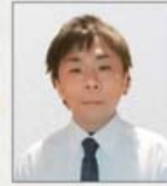
自衛埼玉支部 宮崎支部執行委員長