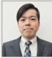
自衛近畿支部 下田支部執行委員長