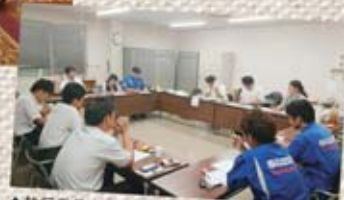
▲執行委員会の様子