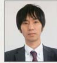
自衛鳥取支部 瀬支部執行委員長