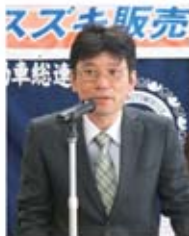
▲昇中央執行委員長