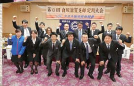
第10回 自販滋賀支部定期大会