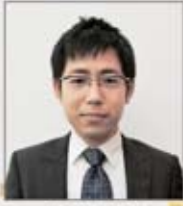
自衛松山支部 香川支部執行委員長