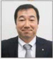
自衛北海道支部 東支部執行委員長