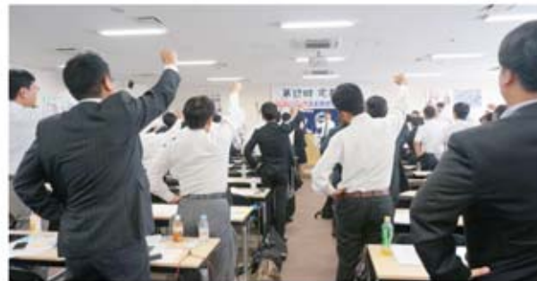
▲全員でガンパロー締め