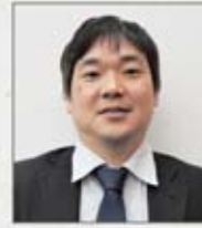
自衛福岡支部 寄田支部執行委員長