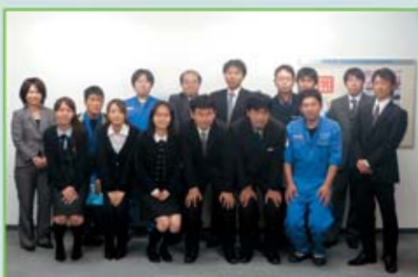
自販西埼玉支部 組合役員の皆さん

Q 最後に一言(または、メッセージ)をお願いします。 働きやすい職場作りに頑張っています。(株)スズキ自販西埼玉がもっといい会社になるように頑張りますので、皆さんよろしくお願いします。