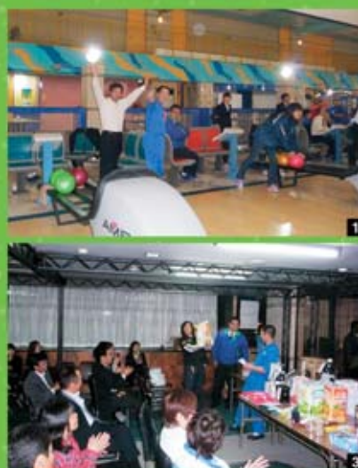
1 みんなで盛り上がってます! 2 みんなでピース! 3 お米をゲットしました!!