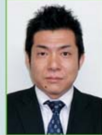
金井支部執行委員長

お客様あつての会社、会社あつての組合であることを組合員に再認識させていきたいと思っています。