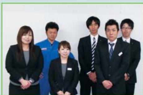
自販鳥取支部 組合役員の皆さん