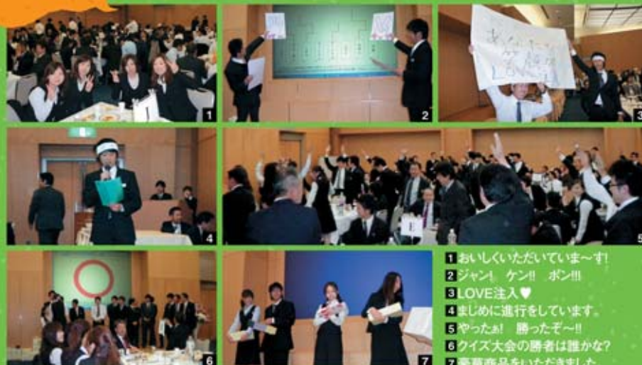
1 おいしくたいいていま〜!! 2 ジャン! ケン!! ポン!!! 3 LOVE注入♥ 4 楽しみに進行をしています。 5 やったお! 勝ったぞ〜!! 6 クイズ大会の勝者は誰かな? 7 豪華商品をいただきました。