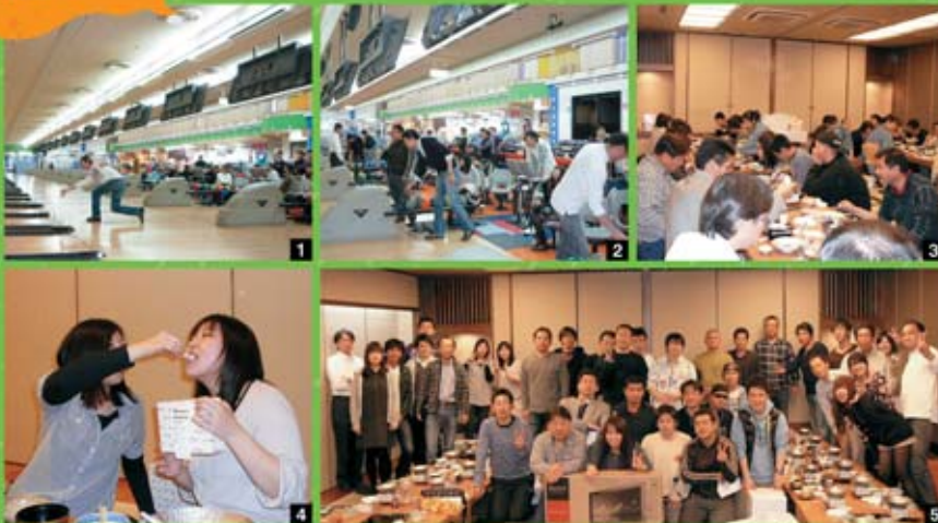
1 それっ! 2 楽しくボウリングができました。3 「しゃぶしゃぶ」おいしかったです。 4 おいし〜☆ 5 みんなで写真撮影です☆