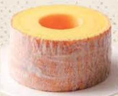
▲高級ケーキのような上品な味わい

パウムクーヘンNo.1!! 今までに無い柔らかさとしっとり感、とても美味しいですよ♪浜松のお土産には最高です!