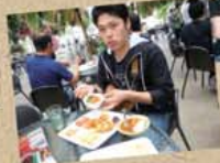
動物も人も ランチタイム