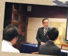
▲執行委員会の様子