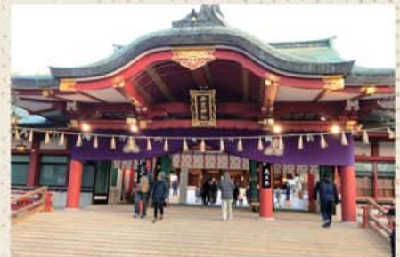
▶商売繁盛で笹持って来い

えびす様をおまつりする神社の総本山、あの福男や十日戎(とおかえびす)で有名です。初詣も賑わいます。