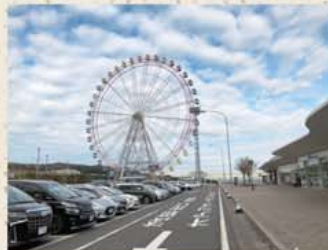
▲大橋の勇壮な景観を間近で眺められるSA、通称「橋のみえる丘」