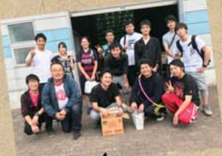
高部常務、差し入れありがとうございます!