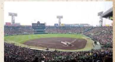
▲2019年高校野球選手権大会、春は第91回、夏は第101回が開催