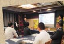
▲執行委員会の様子