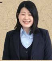
報告者：榎本副支部執行委員長

会社の状況を早くに知ることができると、他拠点の社員の方と情報共有できることです。