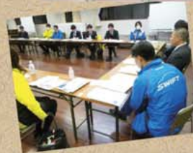
◀執行委員会の様子