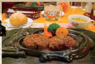
▲看板商品「げんこつハンバーグ」