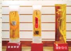
▲人の身長ほどある記念撮影用うなぎパイ

浜松のお土産、夜のお菓子といえば「うなぎパイ」!! 嫌いな人はいないはず…。家族や会社へのお土産に喜んでもらえること間違いなし!