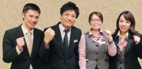
報告者：左から大川副支部執行委員長、原田支部書記長、福原副支部執行委員長、有賀副支部執行委員長

会社と直接交渉ができることや、研修を通じて他支部の方々と会う機会があり、情報交換ができることです。現在、専門部組織強化を頑張っています。